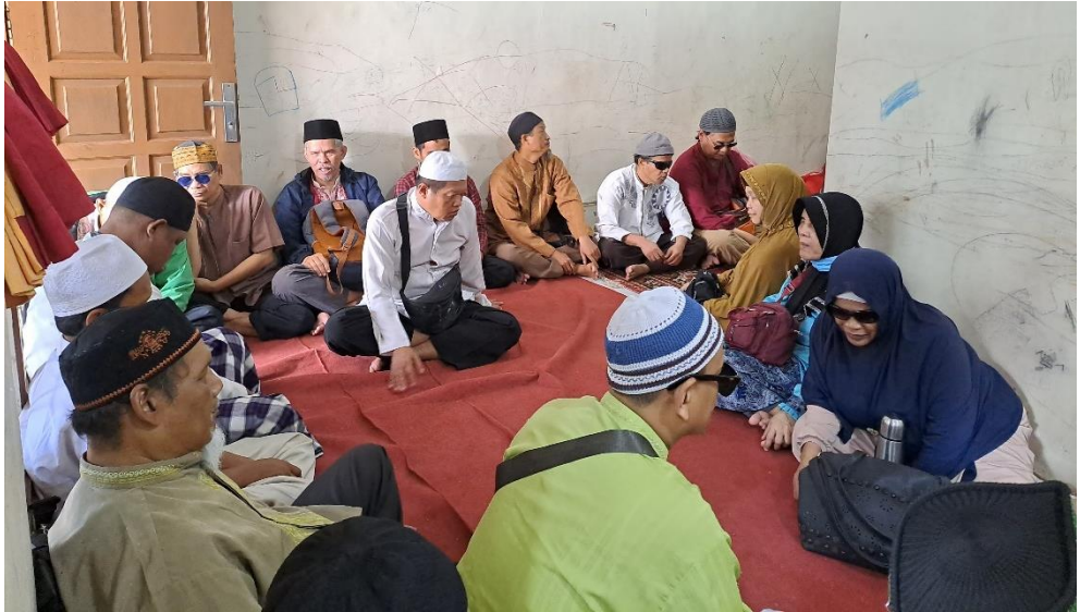
Kegiatan tadarus Al-Qur'an Bersama