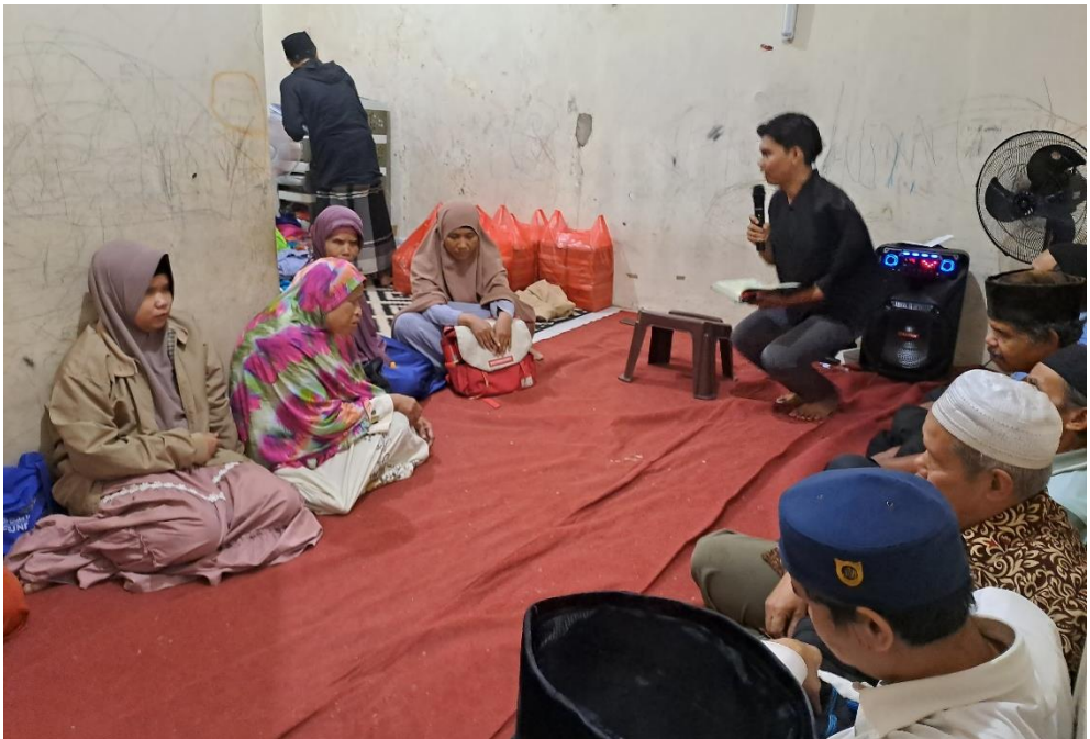
Pengajaran hafalan Al-Qur'an Talaqqi oleh guru Tahfiz.